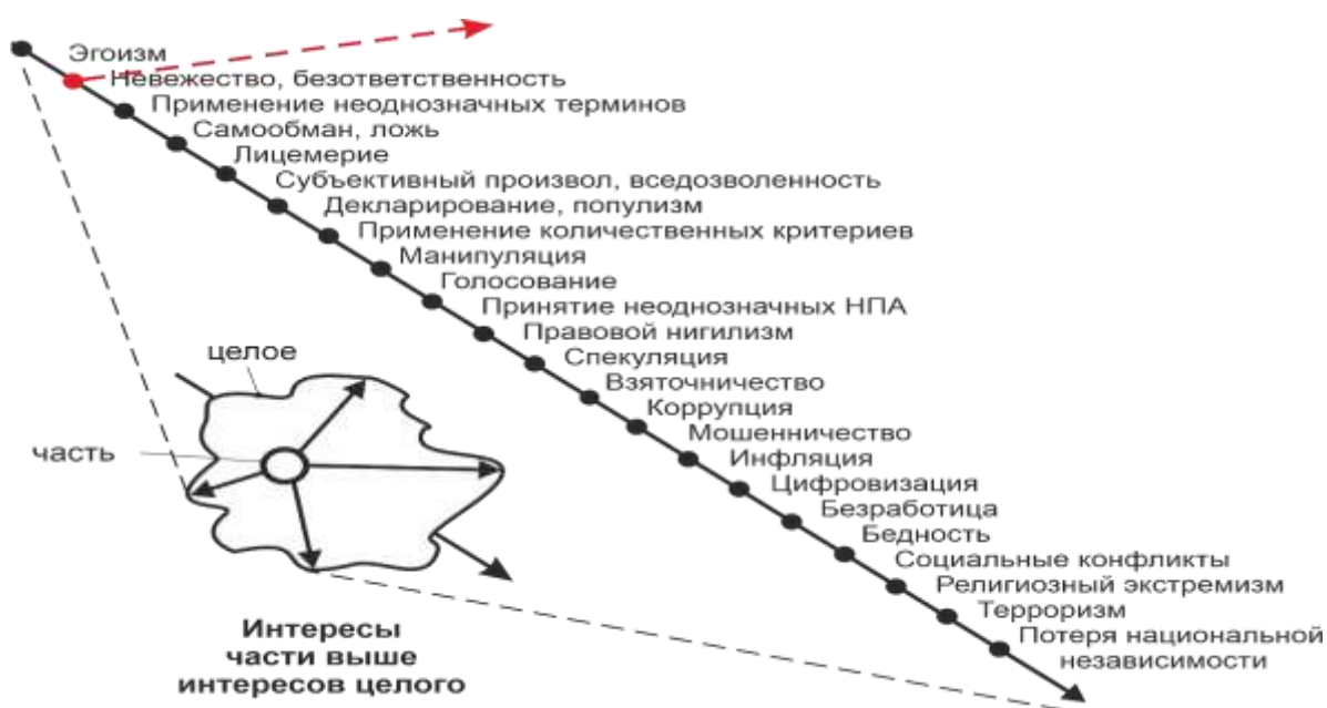
Рисунок 2 – Логические последствия эгоизма и невежества

Свойственная большинству стран траектория паразитического бытия и саморазрушения в основном обусловлена недостаточностью профессионализма стратегических субъектов – аналитиков, педагогов и управленцев [4, С. 127]. Согласно схеме (Рисунок 2), становится очевидно, что исходным основанием разрушительных процессов является эгоизм человека, обусловленный естественным инстинктом самосохранения. Он присущ каждому с младенческого возраста - когда, выражаясь философским языком, интересы части преобладают над интересами целого. Только со временем, благодаря образованию и социализации, может происходить переоценка ценностей и меняться отношение человека к окружающей действительности. Например, индивидуальные потребности начинают отходить на второй план по отношению к гражданским обязанностям. Осваивая культуру, понимая суть и возможность системного бытия, приобретая высокие духовные качества и целостное мировоззрение, человек приходит к осознанию необходимости подчинения интересов части интересам целого. С этого начинается формирование интеллектуального иммунитета.